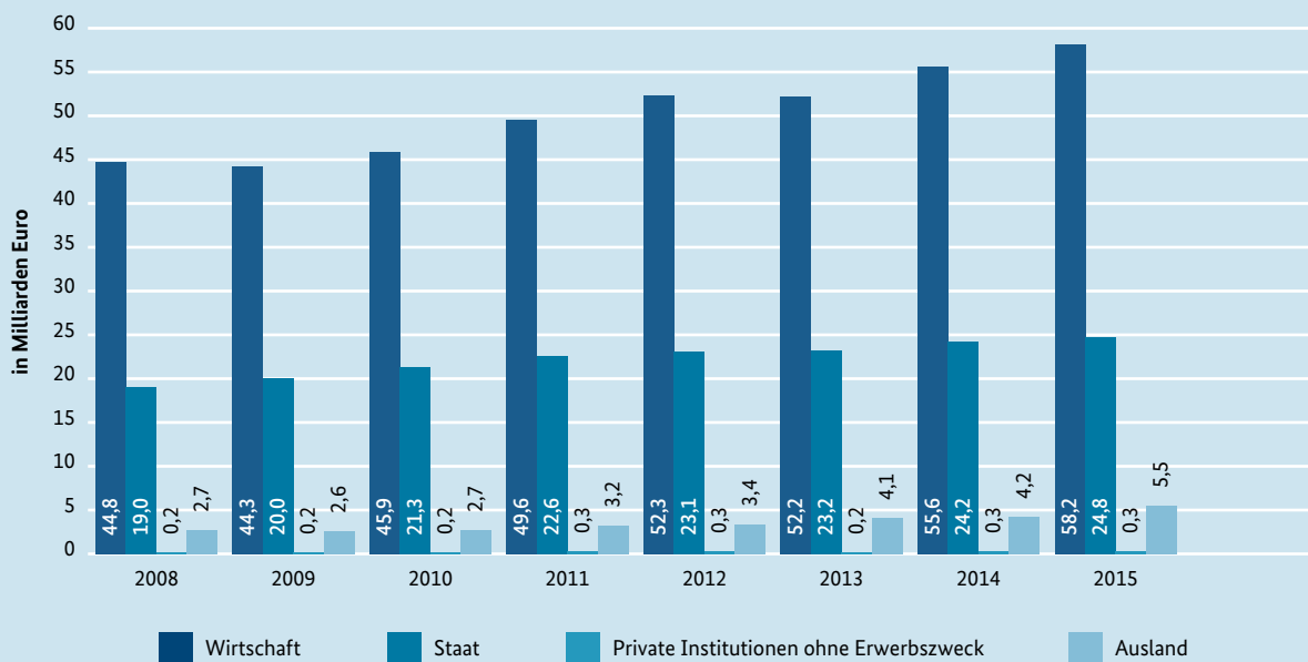
BAFE in % des BIP 1